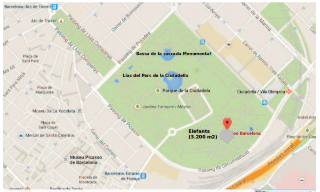
Comparativa: superfície instal·lació elefants en relació a la resta del Parc de la Ciutadella

Per fer-nos una idea millor del que significa aquesta ampliació en superfície, adjuntem una imatge del Google Maps on podem veure l'espai que ocupen aquests 3.200m 2 . Ho podem comparar, per exemple, amb la superfície del llac del Parc de la Ciutadella, tal i com es veu a la següent imatge: