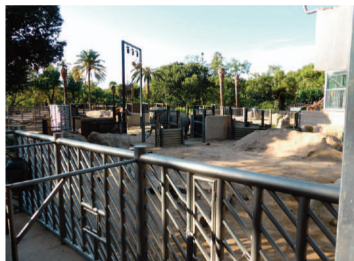
Actual instal·lació dels elefants en reformes

• Bully: Va arribar al zoo de Barcelona al 2012. Prové del Bioparc de València, on vivia amb 10 elefants africans més, un mascle i 8 femelles. Va néixer en estat salvatge al 1985 i va arribar al zoo de València al 2007, des del Circ Mundial. Al 2008 es tanca l'antic zoo de València i s'inaugura el Bioparc, on es va traslladar a Bully.