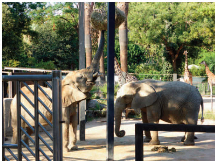
Dues de les elefantes