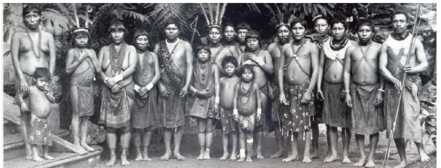
Indígenes Kalina, París, 1892 (Autor: Prince Roland Bonaparte)

Van ser molts els casos de nadius expatriats a la força durant les últimes dècades del segle XIX, i primeres del segle XX, amb la finalitat de ser exhibits al món occidental. Però de tots aquests, ens ha arribat un llegat de dos casos que han estat documentats a partir de dos àlbums de fotografies del príncep Roland-Napoleon Bonaparte i que es troben a la "Bibliothèque Nationale Française", a París. En aquests llibres es troben, com a mostraris humans, diverses fotografies de nadius xilens forçats a fer gira euro-