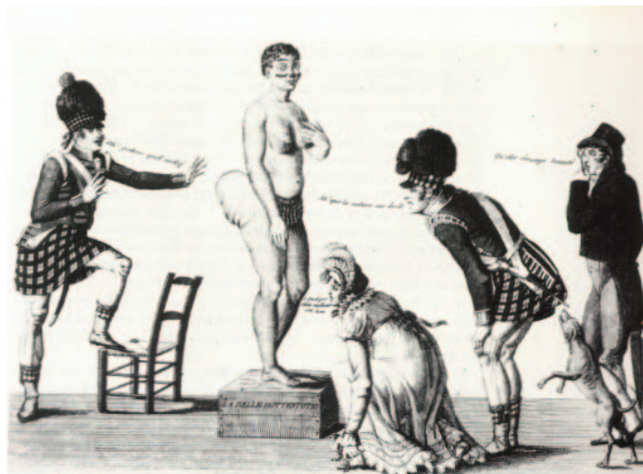
Hottentot Venus, segle XIX (Autor desconegut)

Saartjie Baartman va néixer el 1789 a Sud-Àfrica. Originària del poble khoikhoi, conegut com hotentot (terme usat despectivament, que significa tartamut en holandès), va ser portada a Londres l'any 1810, als 21 anys d'edat.