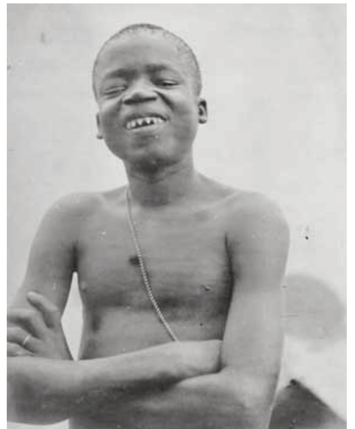
Ota Benga, 1904

Madison Grant, un científic racista i eugenista, conjuntament amb el conservacionista i director del mateix zoològic, William Hornaday, van planejar una forma de promocionar el "racisme científic". Decidiren exposar a Ota Benga conjuntament amb un orangutan, formant part de la "Casa dels Micos". Benga va fer-se famós com "La Baula Perduda", concepte pel qual volia fer-se entendre que l'africà s'ubicava en una posició a camí entre el mico i l'home.