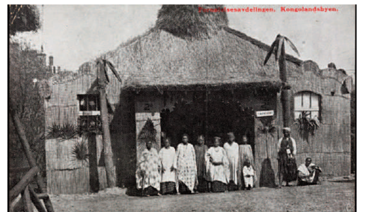
Exposició "Vila Congo", 1914

Avui en dia, existeix una controvèrsia en referència a una exposició actual a Oslo, que intenta reproduir l'original exposició del 1914. Es tracta d'una mostra