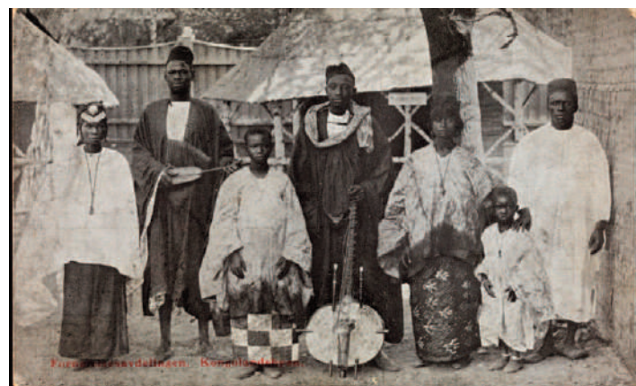
Africans a l'exposició "Vila Congo", 1914

Amb motiu del primer centenari constitucional, un poble exposició conegut com "Kongolandsbyen" (o "Vila Congo") va ser exhibit al 1914 durant cinc mesos. El propi rei de Noruega va oficiar la inauguració. Hi visqueren 80 persones d'origen africà, la majoria de Senegal, i reproduïen usos i costums africans.