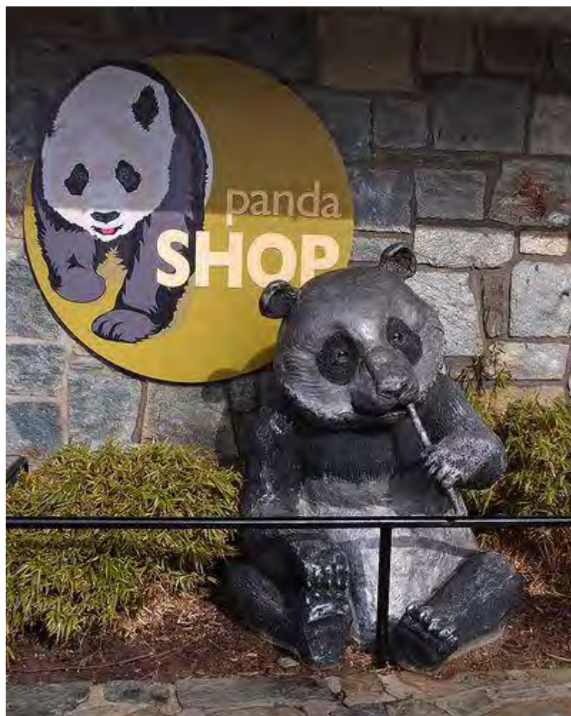
Tienda de merchandising en el Smithsonian (EEUU).

Casi inmediatamente después de cada nacimiento, el dinero empezó a llegar a raudales.