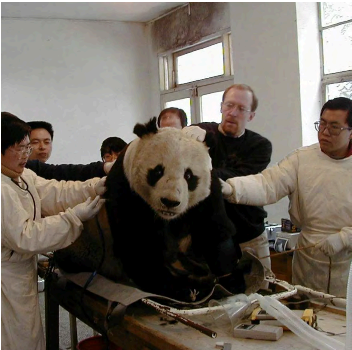
Panda despertando de la anestesia tras ser sometida al proceso de inseminación artificial.