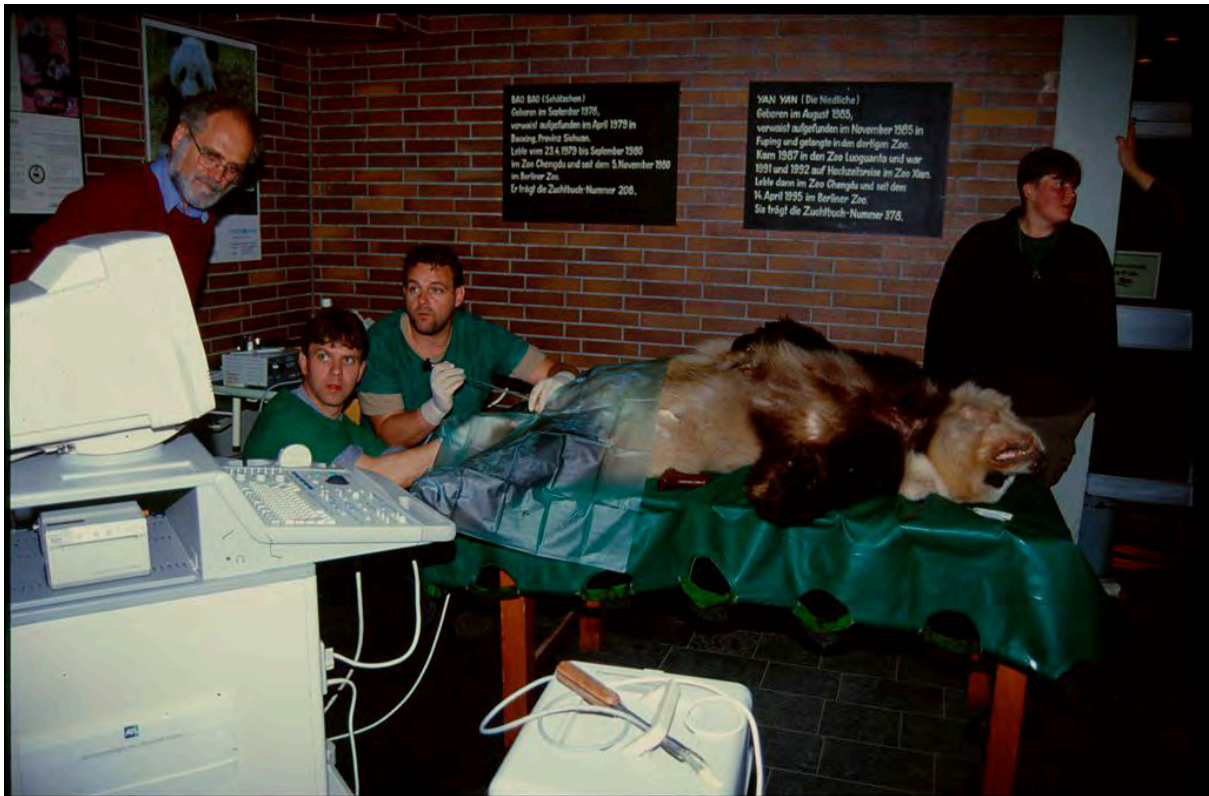
Panda durante una inseminación artificial en el zoo de Leibniz (Alemania).

La base de investigación de cría de pandas gigantes de Chengdu, que hoy posee un tercio de los pandas cautivos del mundo, negó haber utilizado nunca voltaje excesivo o haber dañado de otro modo a los animales. “No hemos tenido ningún panda gigante que haya sufrido daños a la salud o haya muerto durante una cirugía debido al uso de ketamina”, afirmó el centro en un comunicado.